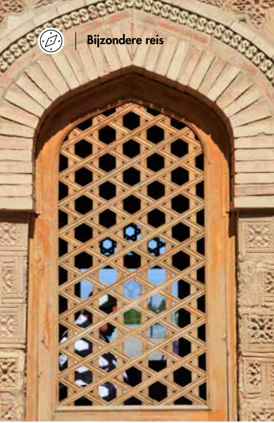
MAUSOLEUM VAN AISHA BIBI – TARAZ

weidsheid en ruimte. Paarden, koeien, schapen en een paar jurts. Midden tussen de Edelweiss en de paardendrollen staan onze campers op deze schitterende vlakte. De afdaling gaat stukken makkelijker. Wij stoppen regelmatig om niets van dit natuurschoon te missen. Zelfs de honderden foto's kunnen niet weergeven wat wij in werkelijkheid zien. Via een goede vierbaanse autoweg komen we bij een hotel, in hartje centrum van Bishkek. Maar niet nadat wij eerst met zijn allen onze jerrycans met diesel hebben gevuld en daarna in grote plastic vuilniszakken hebben verpakt. Nu maar hopen dat de hoeveelheid toereikend is om Oezbekistan door te komen.