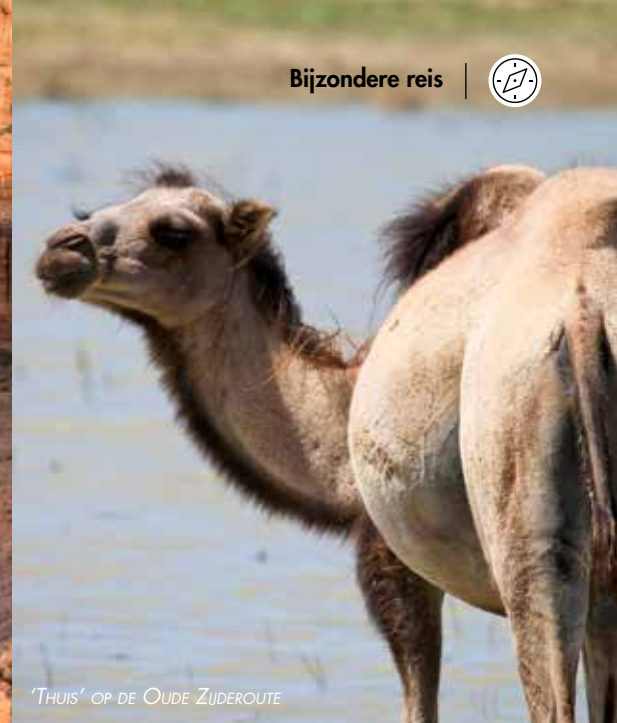
'THUIS' OP DE OUDE ZUIDERROUTE