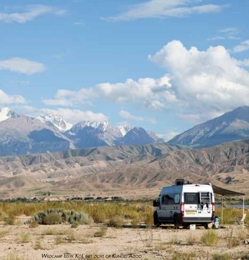
WILDCAMP ISSYK KÖL MET ZICHT OP KUNGEJ ALTOO

40 jaar met zijn arend op dieren. Hij heeft het vak geleerd van zijn grootvader en het kost jaren om de arend zo te trainen dat hij doet wat jij wilt. Met zijn arend loopt de jager een heel eind bij ons vandaan. De prooi, een klein konijntje, wordt door de buurjongen uit een tas gehaald en op de grond gezet. Het beestje blijft verdwaasd zitten en vergeet te rennen. De arend wordt losgelaten, stort zich op het konijntje en binnen een seconde is hij dood. Wij staan er wat ontgoocheld naar te kijken.