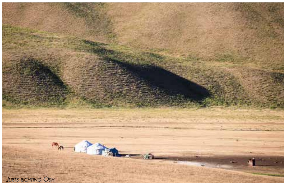
JURTS RICHTING OSH

weidsheid en ruimte. Paarden, koeien, schapen en een paar jurts. Midden tussen de Edelweiss en de paardendrollen staan onze campers op deze schitterende vlakte. De afdaling gaat stukken makkelijker. Wij stoppen regelmatig om niets van dit natuurschoon te missen. Zelfs de honderden foto's kunnen niet weergeven wat wij in werkelijkheid zien. Via een goede vierbaanse autoweg komen we bij een hotel, in hartje centrum van Bishkek. Maar niet nadat wij eerst met zijn allen onze jerrycans met diesel hebben gevuld en daarna in grote plastic vuilniszakken hebben verpakt. Nu maar hopen dat de hoeveelheid toereikend is om Oezbekistan door te komen.