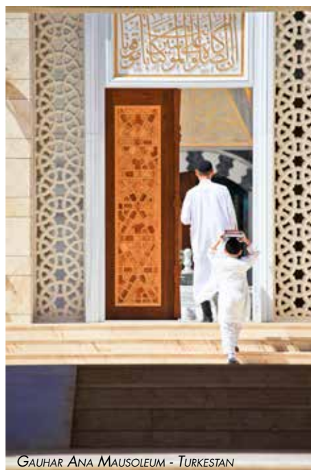
GAUJAR ANA MAUSOLEUM - TURKESTAN