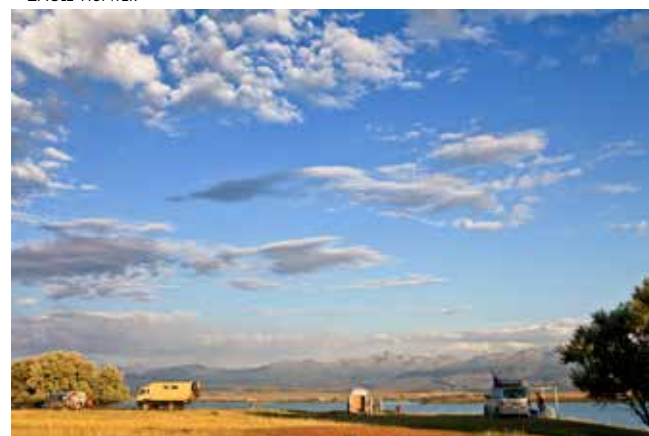
WILDCAMP ISSYK KÖL MET ZICHT OP KUNGEJ ALTOO ~