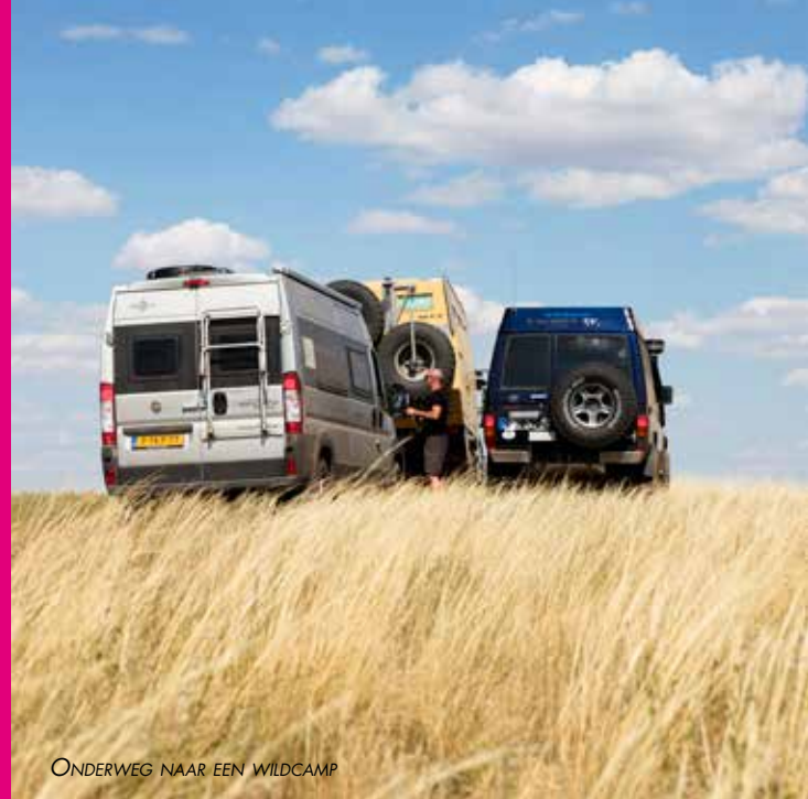
ONDERWEG NAAR EEN WILDCAMP