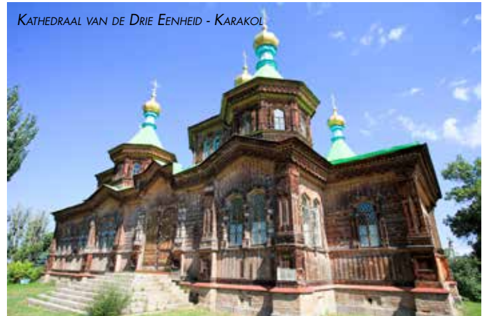
KATHEDRAAL VAN DE DRIE EENHEID - KARAKOL