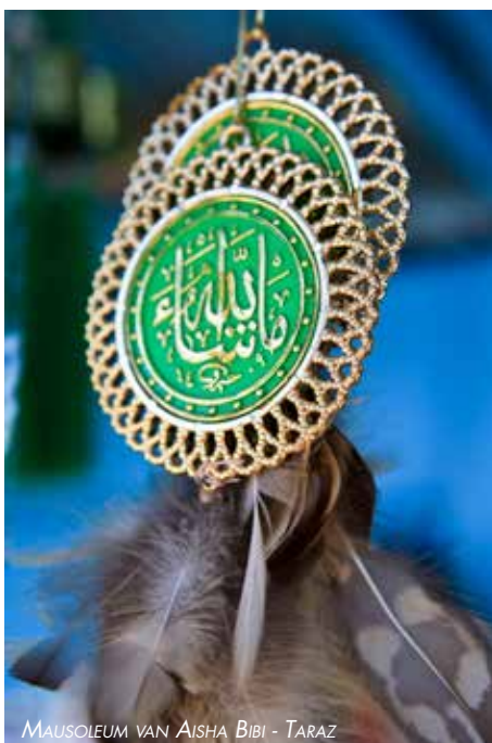
MAUSOLEUM VAN AISHA BIBI - TARAZ

Een land omgeven door hoge bergtoppen van meer dan 7000m met daartussen kraakheldere meren. Meer dan 90% van het grond-