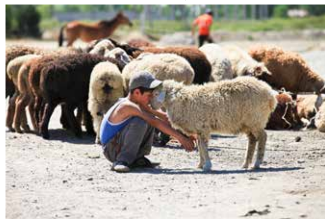
VEEMARKT - KARAKOL ~~